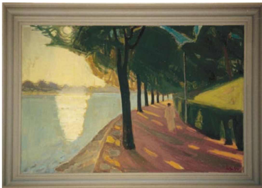
Kærlighedsstien, 1954. Tilhører Museet på Koldinghus.